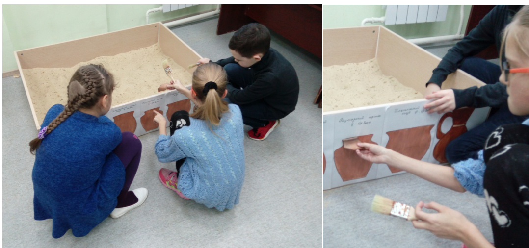
Фото 1. Младшие школьники занимаются в «Археологической/палеонтологической песочнице» музея «Винновская гора»

– использование дидактических игр по краеведению способствует формированию познавательного интереса младших школьников при освоении учебного курса «Окружающий мир».