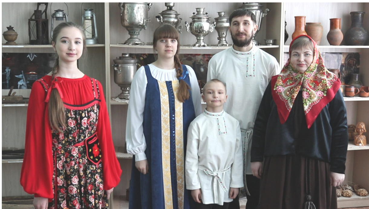
Фото 1. Коллекция русского национального костюма Симбирской губернии

На базе музея проводятся не только экскурсии, но и предметно-бытовые гостиные, фестивали народного творчества, литературные вечера. Основной состав посетителей – учащиеся, студенты, взрослые, родители, ветераны, выпускники, учителя, музейные работники, представители СМИ. При музее работает объединение дополнительного образования «Активисты школьного музея», активисты музея занимаются экскурсионной и поисковой работой, обновлением экспозиций в музее. Воспитанники данного объединения неоднократно становились участниками различных городских, региональных краеведческих мероприятий. Музей делится на несколько экспозиций. В экспозиции «Кустарные промыслы Симбирской губернии» можно увидеть орудия труда, предметы XIX – начала XX вв. Одно из центральных мест музея занимает так называемый «бабий кут» – место, где женщины занимались домашними делами: стиркой, глажкой, готовкой еды. Одним из экспонатов данной части экспозиции является рубель. Неоднократно данный предмет становился темой для творческих и исследовательских проектов учащихся по истории, при подготовке своих проектов учащиеся с интересом выясняли у своих родных технику использования рубеля, что однозначно повышало интерес к изучению культурных особенностей родного края.